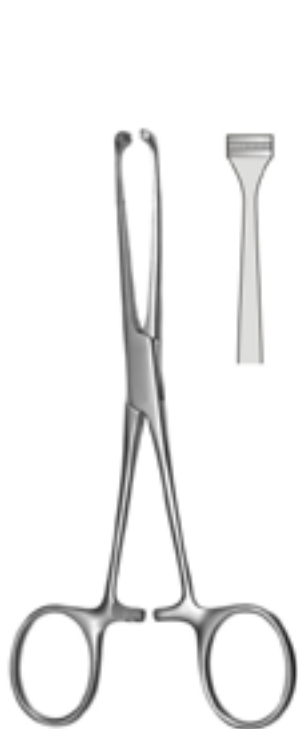
Allis-Atraumatisch 15,5cm AI.110.16