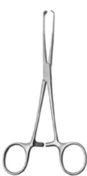
Allis-Baby 12cm AI.100.12